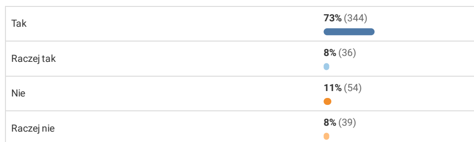
Wykres 5. Czy chcieliby Państwo, aby nowa strefa wypoczynku wyposażona była w lunetę widokową zamontowaną na tarasie widokowym?

Źródło: Opracowanie na podstawie wyników badań ankietowych