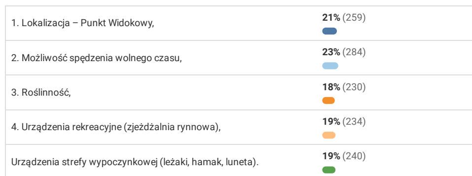
Wykres 6. Co według Państwa wpłynie na atrakcyjność tworzonej przestrzeni rekreacyjnej? (Proszę zaznaczyć max 3).